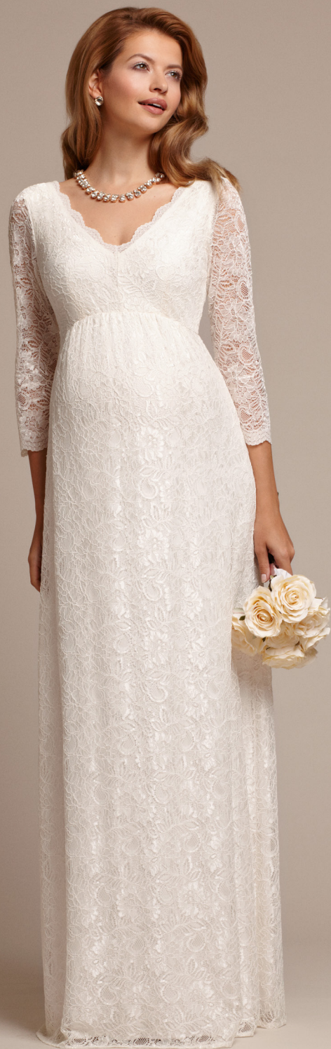
ROBE LONGUE CHLOE IVOIRE