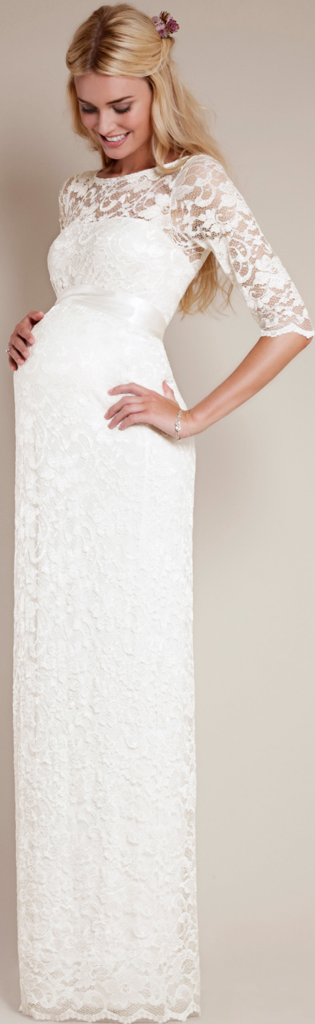
ROBE LONGUE AMELIA IVOIRE