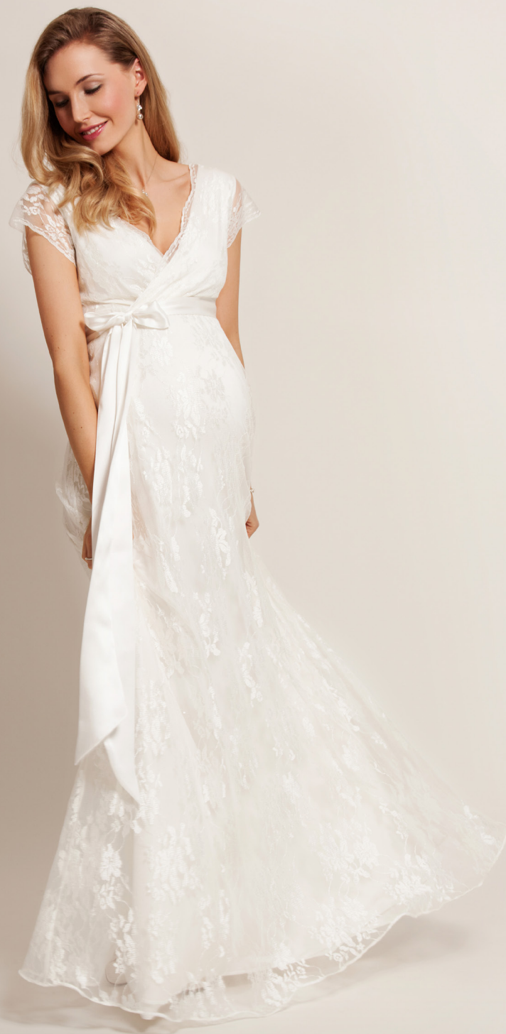
ROBE LONGUE EDEN IVOIRE