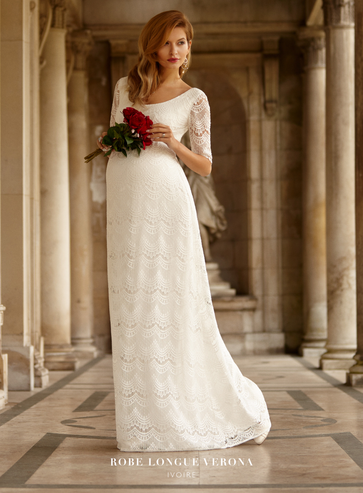
ROBE LONGUE VERONA IVOIRE