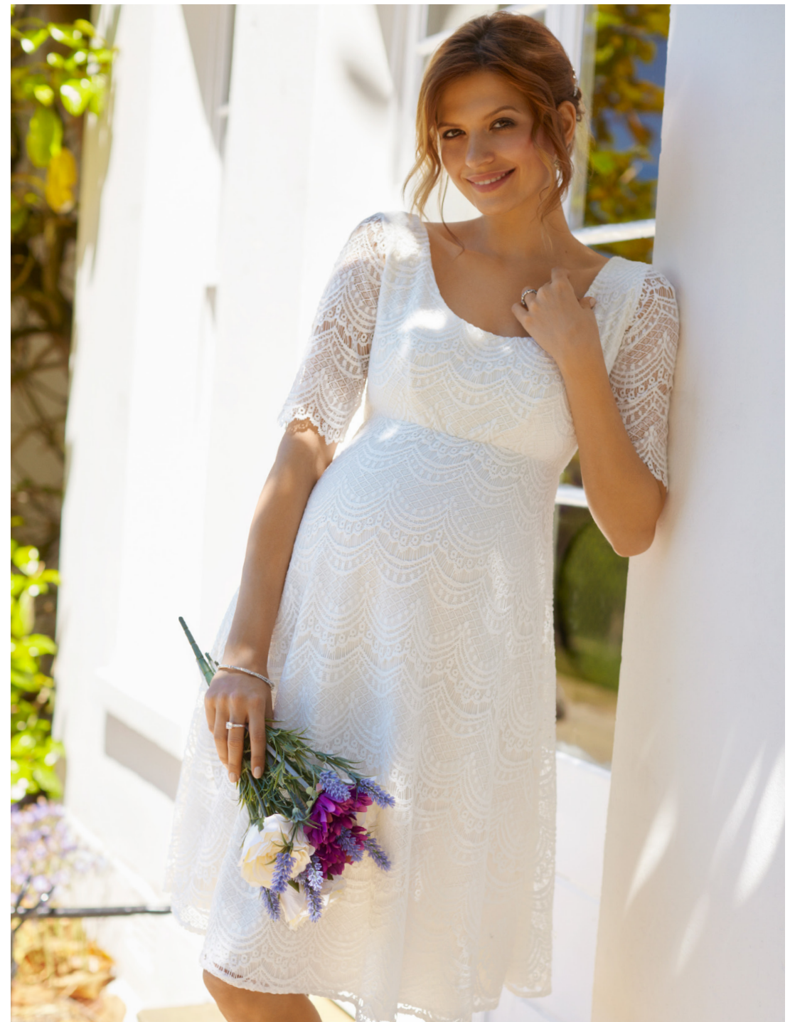
ROBE VERONA IVOIRE