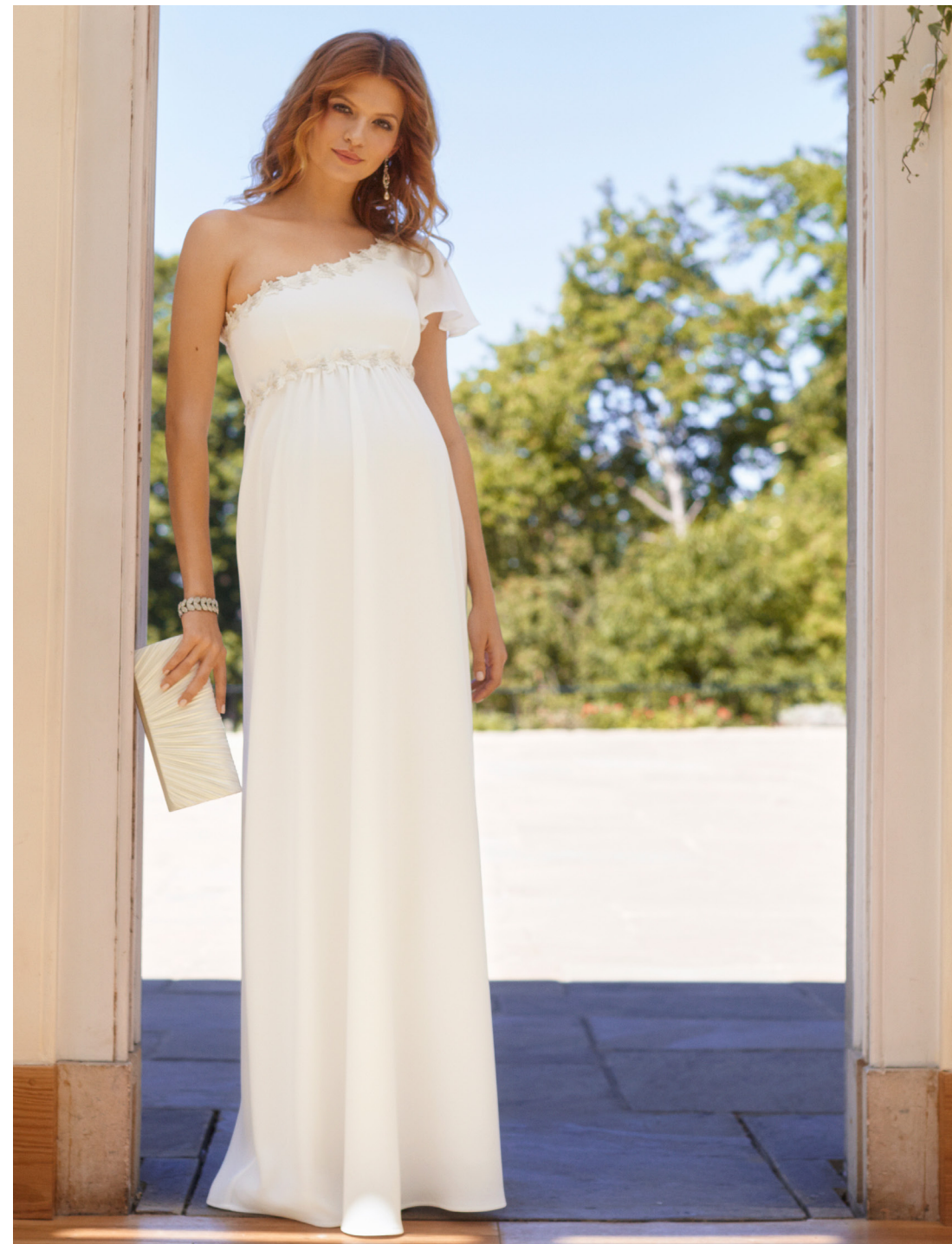
ROBE LONGUE LISBETH IVOIRE