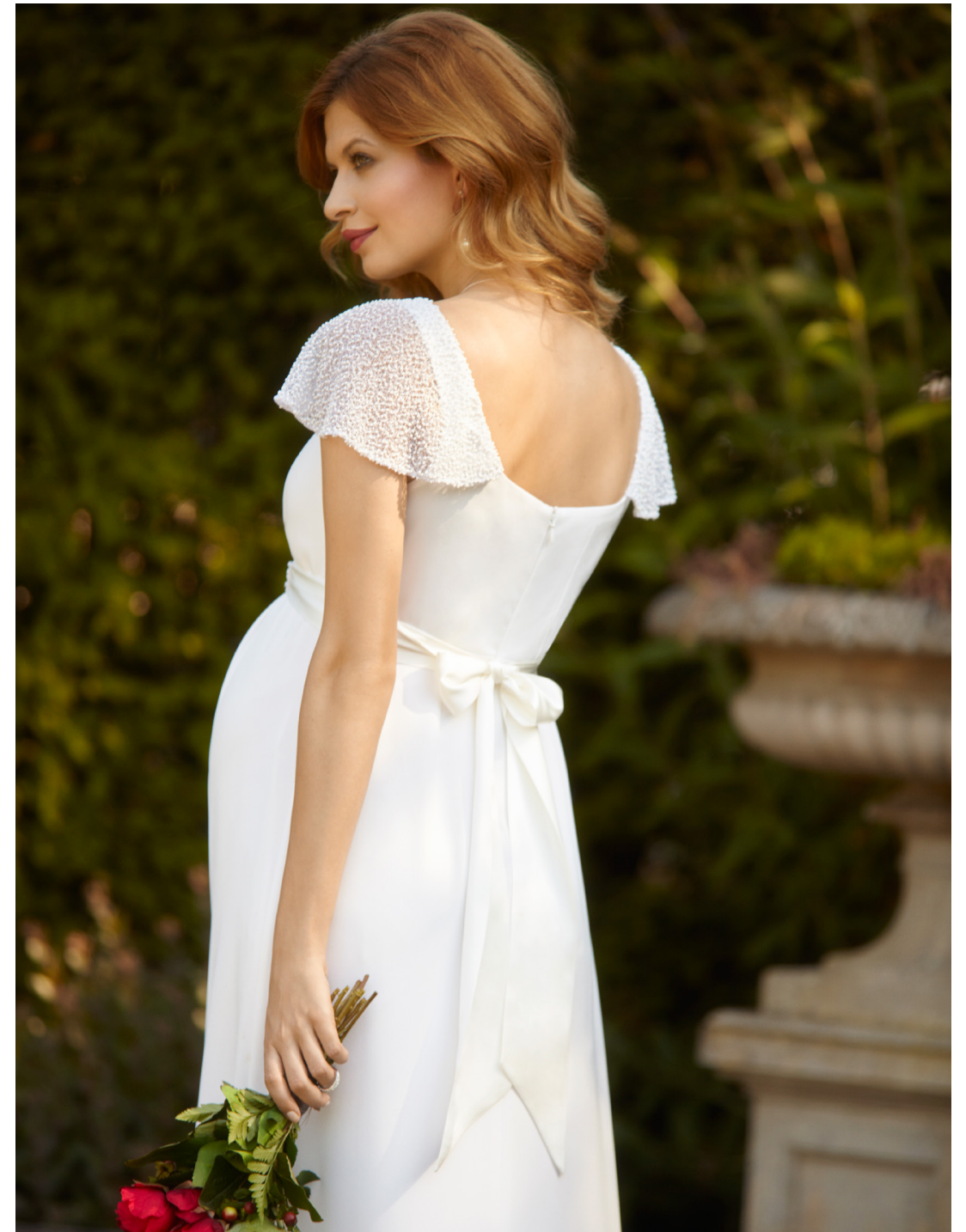
ROBE LONGUE LORELEI IVOIRE