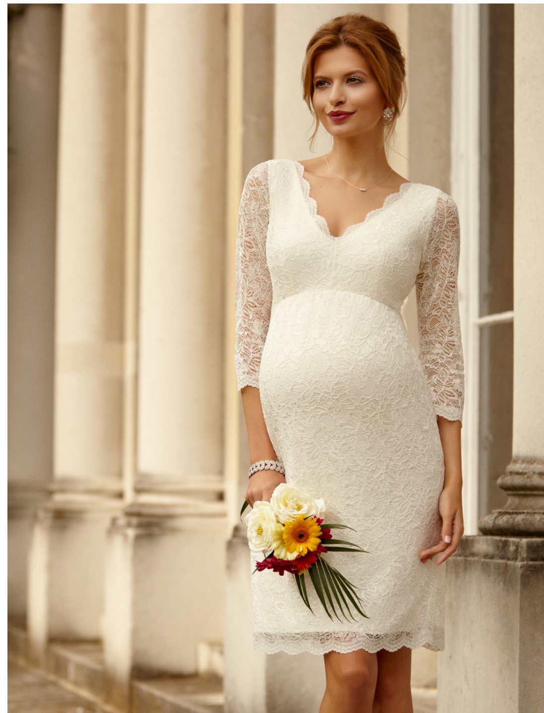
ROBE CHLOE IVOIRE