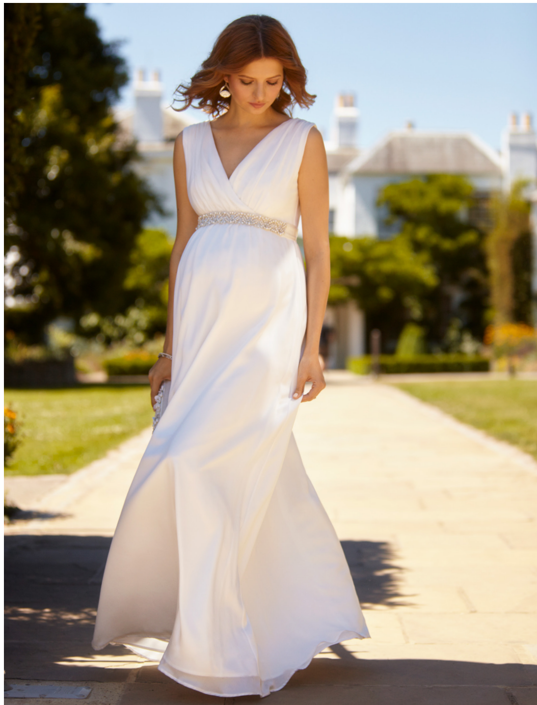
ROBE LONGUE AVA IVOIRE