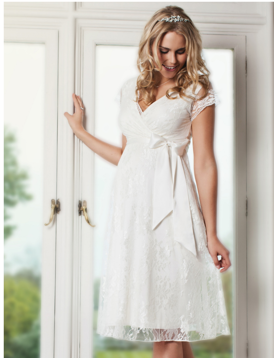
ROBE EDEN IVOIRE