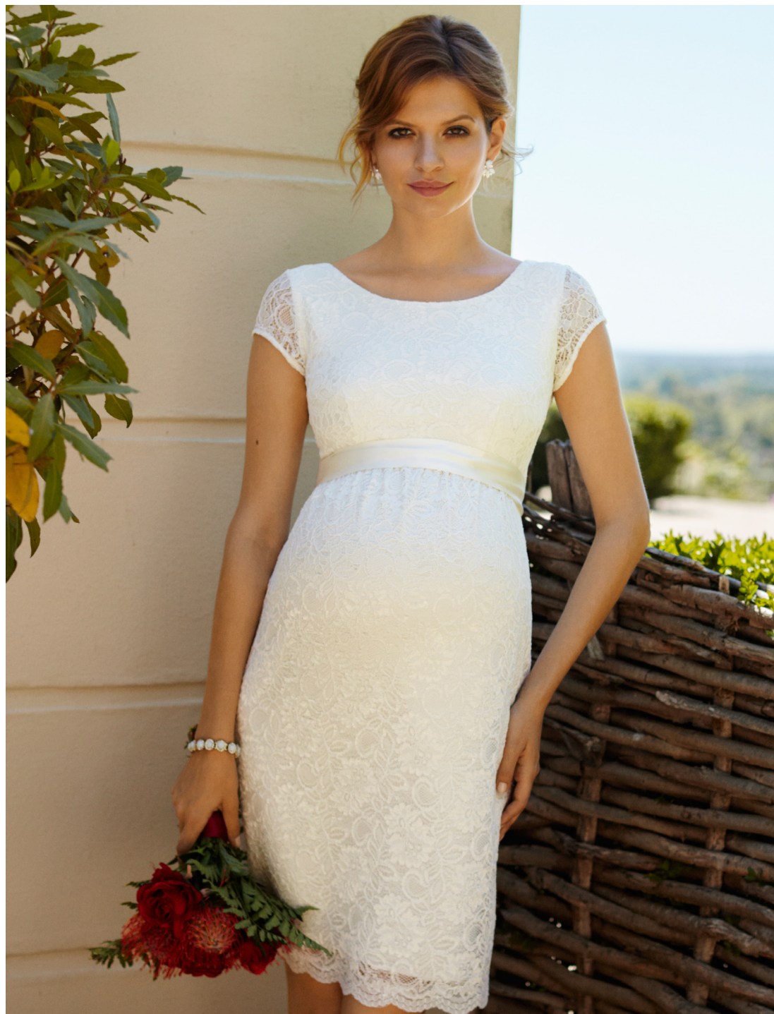
ROBE EMMA IVOIRE