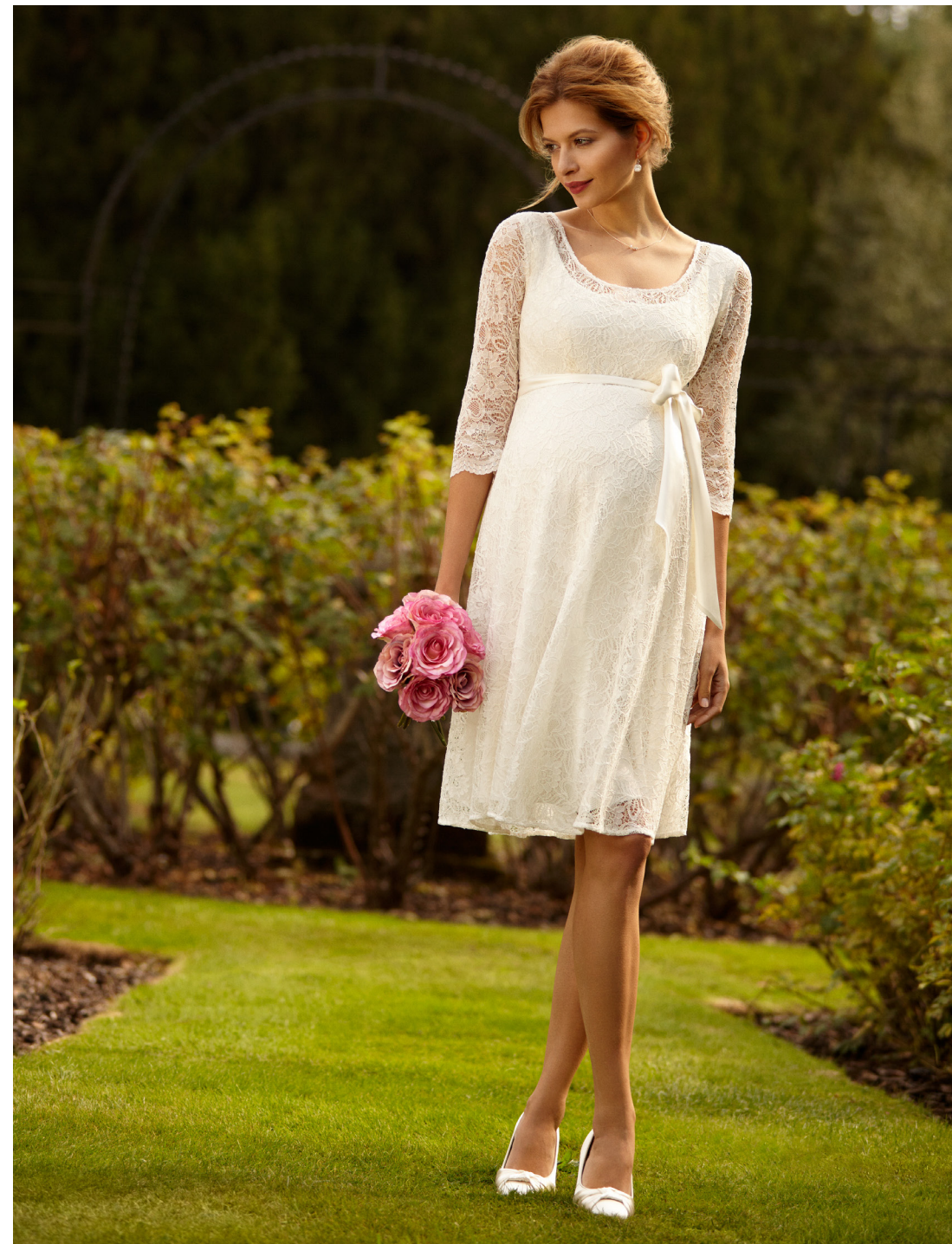
ROBE FREYA IVOIRE