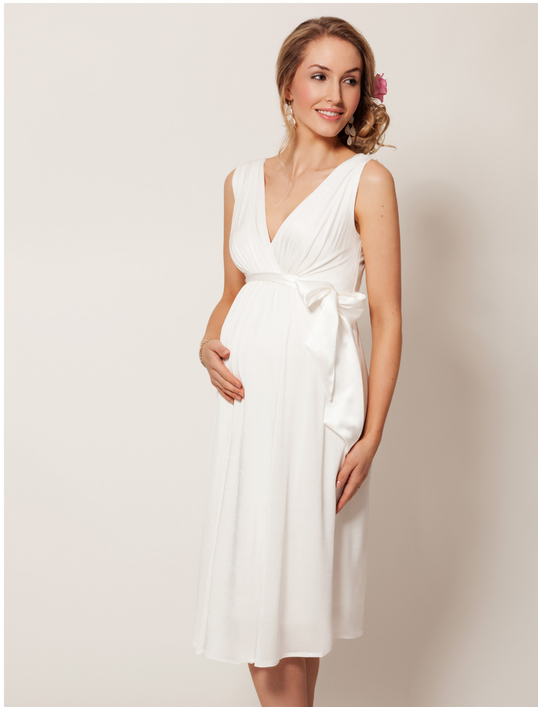
ROBE ANASTASIA IVOIRE